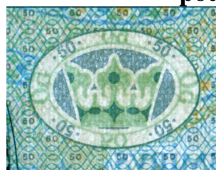
od strony przedniej